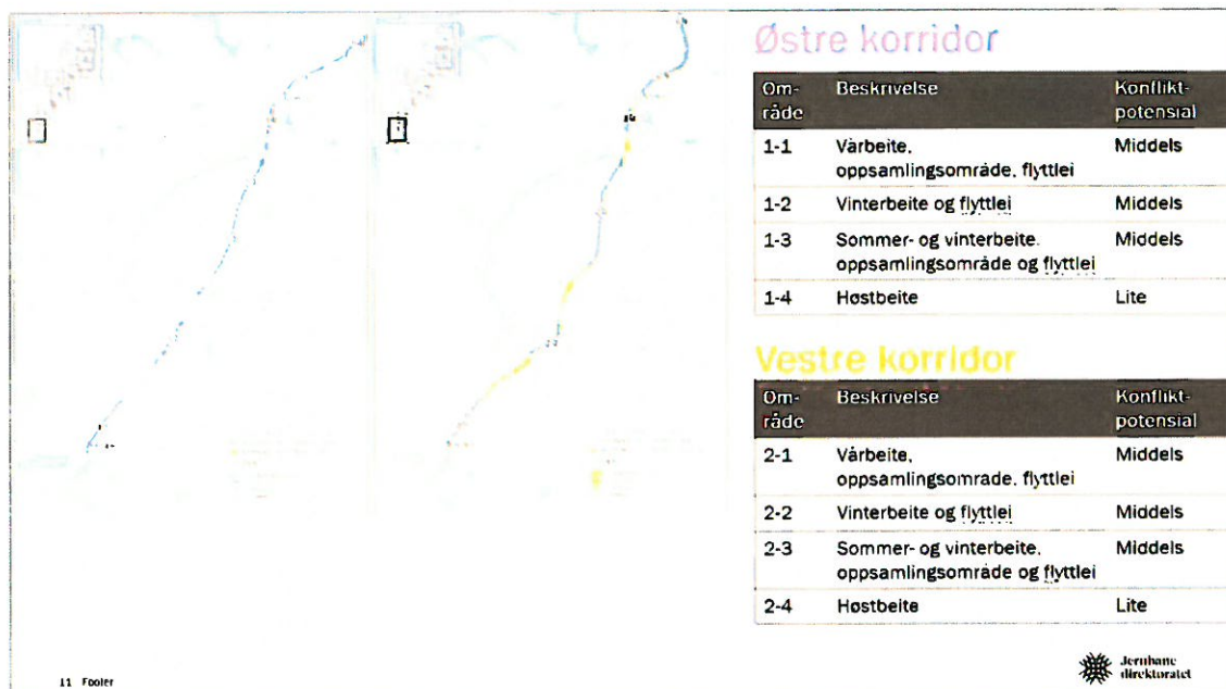
Figur 2: Eksempel på hvordan korridorene ble gjennomgått i konsultasjonen.