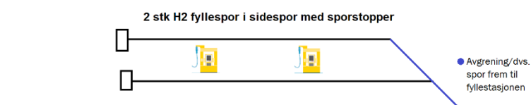
Figur 4: Hydrogen fyllestasjon i sidespor (Foretrukken løsning i KVV Green).

Det er nødvendig å se på om fyllestasjonen skal sidespor som ender i en sporstopper. Hydrogen fyllestasjoner i Europa er normalt bygget i et sidespor med sporstopper. Denne løsningen er godt egnet for motorvognsett som har førerrom i begge ender. For godslokomotiv med hydrogenvogn vil løsningen kreve førerrom i hydrogenvogn eller bruk av skiftelokomotiv.