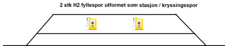
Figur 5: Hydrogen fyllestasjon utformet som stasjon/ kryssingsspor.

bygges nye kryssingsspor fordi dagens kryssingsspor benyttes til kryssing. Et supplerende fyllespor kan kanskje bygges på eksisterende stasjon, men ventetiden for toget som krysser og tanking i sidespor samtidig kan være et problem med hensyn til sikkerhet for 3. person (DSB).