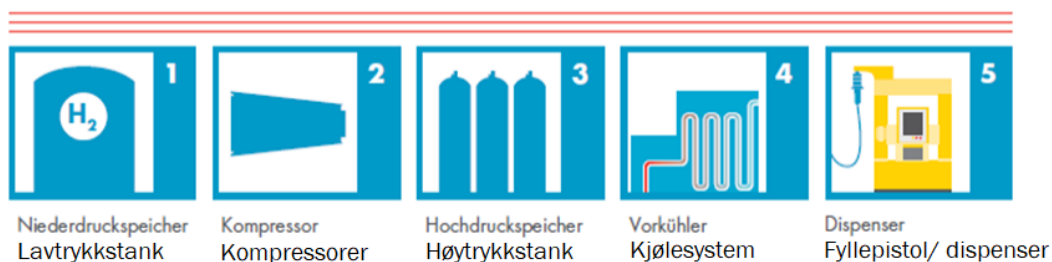
Figur 2: Blokkjematisk fremstilling av en H2 fyllstasjon/ fyllanlegg. Referanse nr. 4, HYRTRAIL side 18

Teknisk blokkjematisk beskrivelse: En stasjonær hydrogen fyllstasjon inneholder flere tekniske systemer.