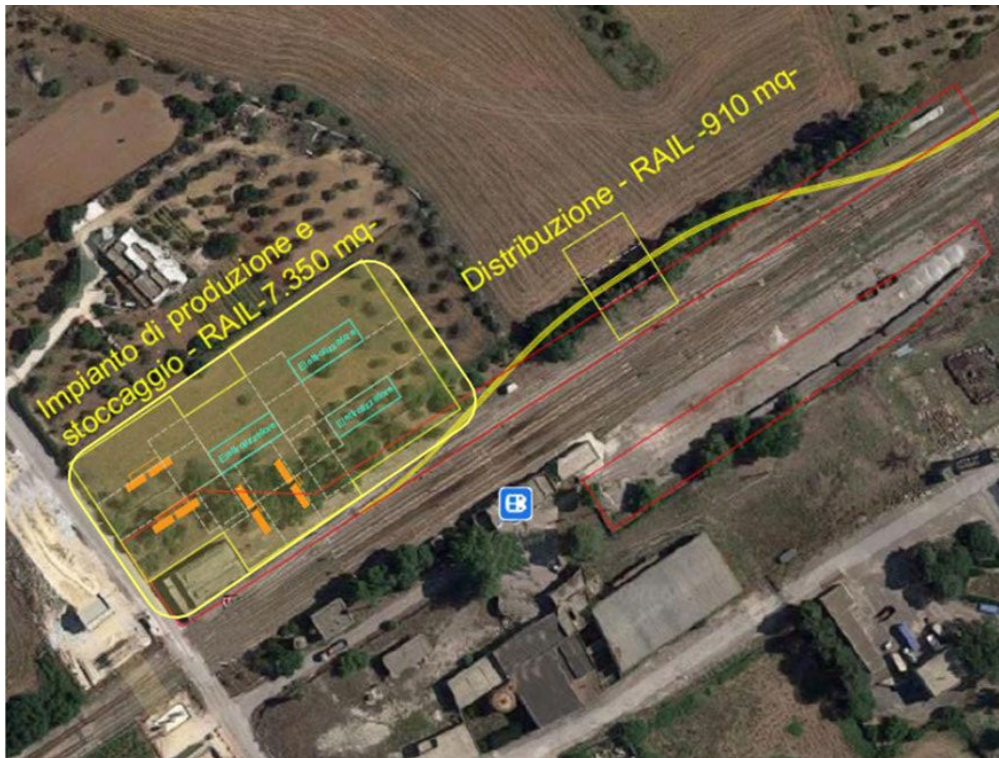
Figur 3: Et eksempel fra Italia på arealbehov for hydrogendepot. Referanse nr. 6 side 10

Anleggets er kun ment for jernbanekjøretøy og har en kapasitet er på 1.000-1.200 kg H 2 i forbruk per dag. For sammenligning med de 9 anleggene i Norge så tilsvarer dette til en liten fyllestasjon. Gultrukken linje langs eksisterende spor viser nytt fyllespor.