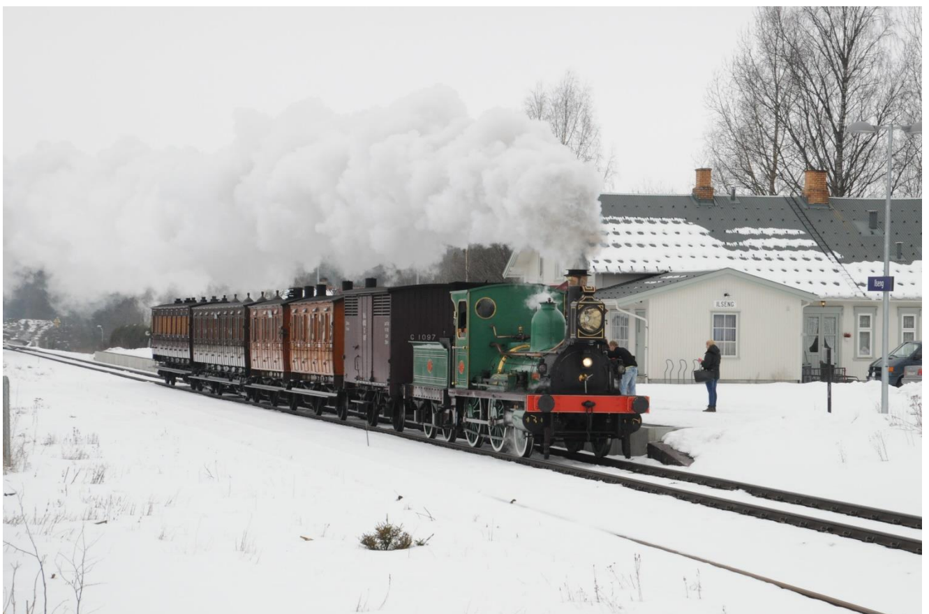
Karetoget er verdens eldste damptog som er drift, og er en større kjendis i utlandet enn i Norge.

Omfattende organisasjonsendringer og et generasjonsskifte blant de ansatte krever at det fortsatt må jobbes godt med å videreutvikle organisasjonen i nærmeste kommende år på museet. Et annet viktig arbeide som er i oppstartsfasen er ny hovedutstilling.