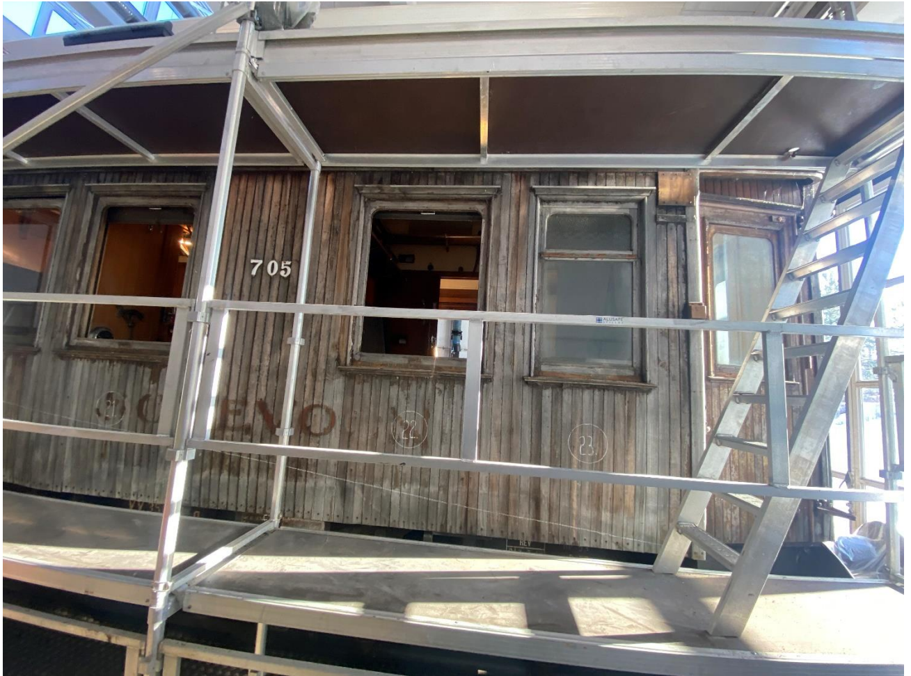
Sovevogn 705 er etter det jernbanemuseet kjenner til verdens eldste sovevogn i teak. Nå blir vogna restaurert.