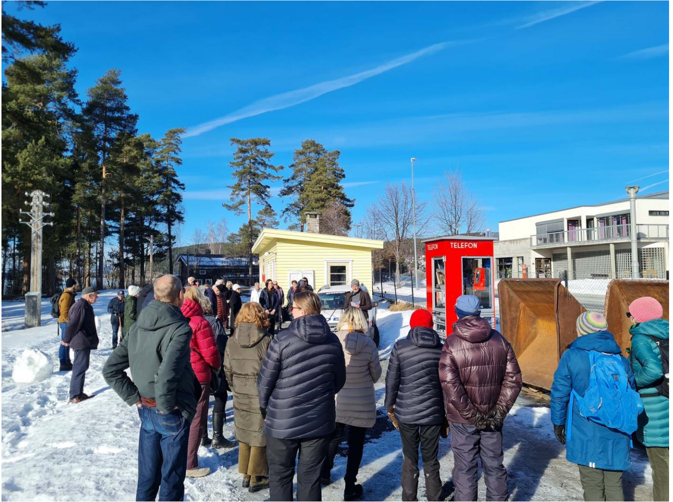
Fra åpningen av lesekosken i februar 2023.