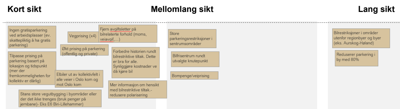
Figur 5-1 Aktuelle tiltak knyttet til bilrestriksjoner, innspill fra arbeidsverkstedet.

De foreslåtte tiltakene i arbeidsverkstedet ble sortert langs en mulig tidsakse, det vil si på kort, mellomlang og lang sikt (Figur 5-1). Etter en gjennomgang med prioritering, ble innspillene avgrenset til et mindre antall mulige tiltak (Figur 5-2).