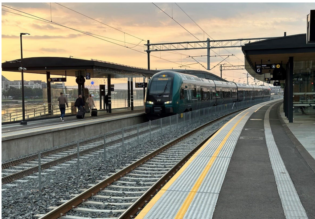
Drammen stasjon er en av stasjonene som ble universelt utformet i 2025.

Stasjonene er: Jaren, Haugenstua, Steinkjer, Gausel, Mariero og Jåttåvågen.